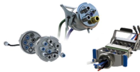
MULTILINE ADAPTIV / E